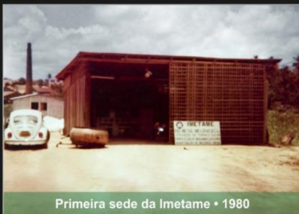
Primeira sede da Imetame • 1980